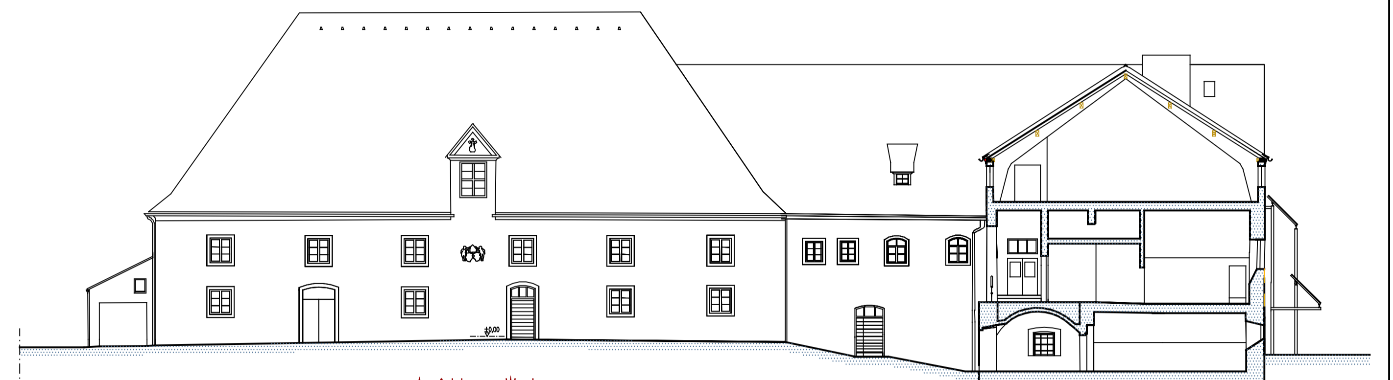
Ansicht von West