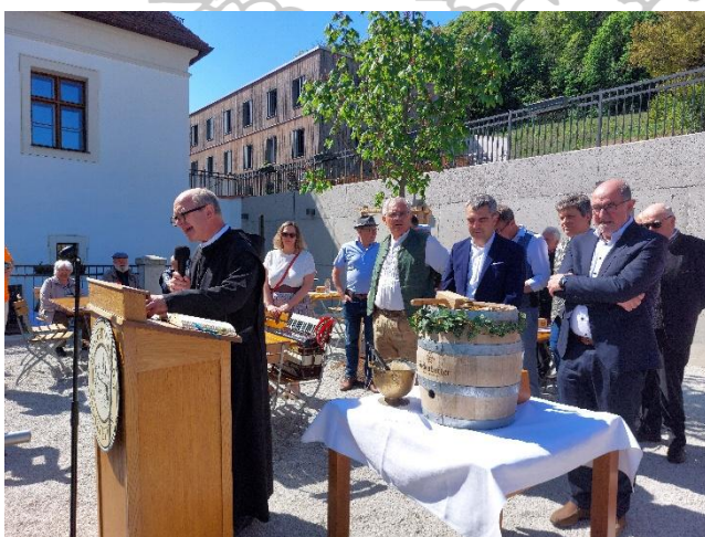
Anstich des Maibockfasses mit Einweihung des Biergartens

Die Nachricht, dass Papst Franziskus am Ostermontag gestorben sei, traf uns aus heiterem Himmel. Keiner im Konvent rechnete mit seinem plötzlichen Heimgang. In gleicher Weise erstaunt waren wir über das Wahlergebnis, das uns am 8. Mai 2025, also am zweiten Wahltag des Konklaves, erreichte. Mit der Wahl eines Amerikaners und dazu noch eines Ordensmannes rechnete im Konvent niemand. Das ruhige und besonnene Auftreten von Papst Leo XIV. beeindruckt uns und glättet hoffentlich so manchen belebten Wellengang in der Kirche und in der Politik.