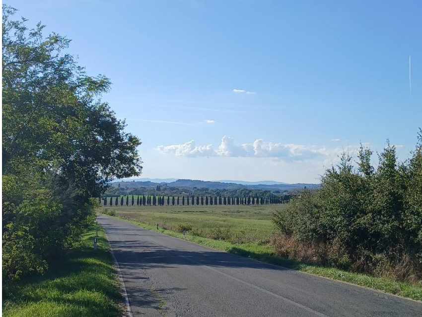
Auf dem Weg nach Monte Oliveto Maggiore (ca. 30 km südöstlich von Siena)

Leider konnte ich meine Rennradwallfahrt als "Pilger der Hoffnung auf dem Weg des Friedens" nicht in einem Durchgang durchführen. Begonnen habe ich meine Wallfahrt am 5. Mai. Ausgangspunkt war Plankstetten, dann ging es in Tagesetappen weiter nach Scheyern, Andechs, Ettal, Stams, Marienberg und Bozen. In den