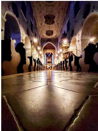
Die Pfarr- und Abteikirche während der Adventszeit

Die Wintermonate sind stark vom Marktgeschehen am 1. und 2. Advent, dem Weihnachtsfest und dem Jahreswechsel mit den Gästen und den Jahresexerzitien geprägt. In der Advents- und Weihnachtszeit, die im vergangenen Jahr am 1. Dezember 2024 begann und am Fest der Taufe des Herrn (12. Januar 2025) endete, kamen viele Menschen nach Plankstetten. So zog der Adventsmarkt, der am 1. und 2. Advent mit seinen 60 Ständen und den inhaltlichen Angeboten stattfand, viele Interessierte nach Plankstetten. Neu war der Schutz des Marktes vor Überfahrtaten: Dieser wurde dadurch gewährleistet, dass die schmale, steile Zufahrt von der Fribertshofener Straße zum Klosterplatz durch einen Betonklotz zugestellt und die untere Hofeinfahrt durch ein Fahrzeug versperrt wurde.